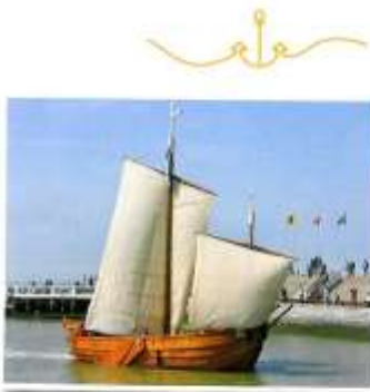
▲ De Blankenbergse schuit B1 Sint-Pieter was de eerste grote verwezenlijking van De Scute

Blankenberge telt heel wat cultuurverenigingen en daar mogen we best trots op zijn. Eén daarvan is vzw De Scute, een erfgoedvereniging die zich specifiek inzet voor de herwaardering van ons maritieme erfgoed. Een nobel doel, dat het stadsbestuur graag steunt door de werkingstoelage van De Scute te verhogen.